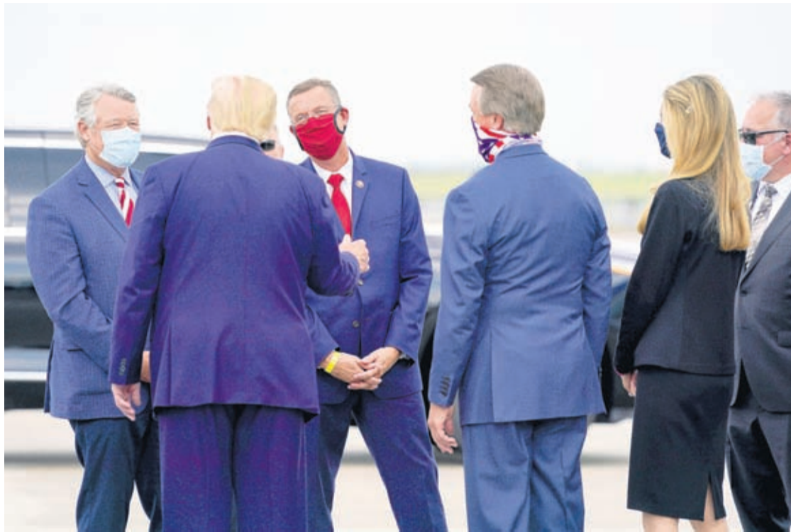
Rep. Doug Collins, R-Ga., in red face mask, talks with President Donald Trump as he arrives at Hartsfield-Jackson International Airport, Wednesday, July 15, 2020, in Atlanta.

Among the major changes: limiting when federal environmental reviews of projects are mandated, and capping how long federal agencies and the public have to evaluate and comment on any environmental impact of a project. "We won't get certain projects through for environmental reasons. They have